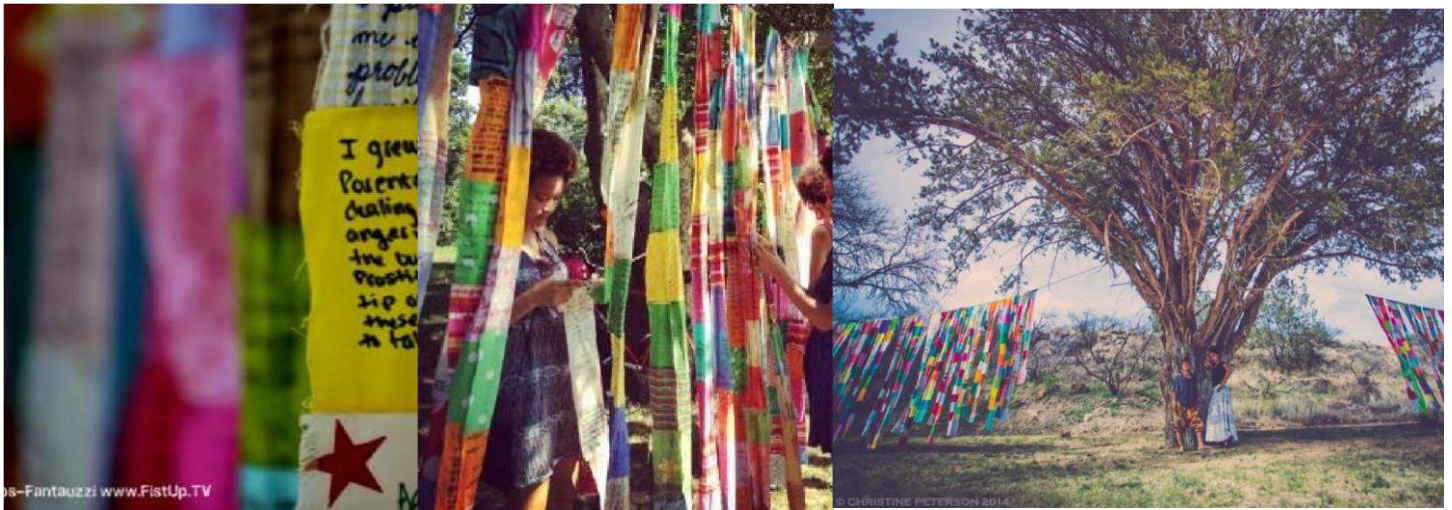
Figure 1: photos extraites du projet S.T.I.T.C.H.E.D http://www.climbingpoetree.com/experience/projects/stitched/